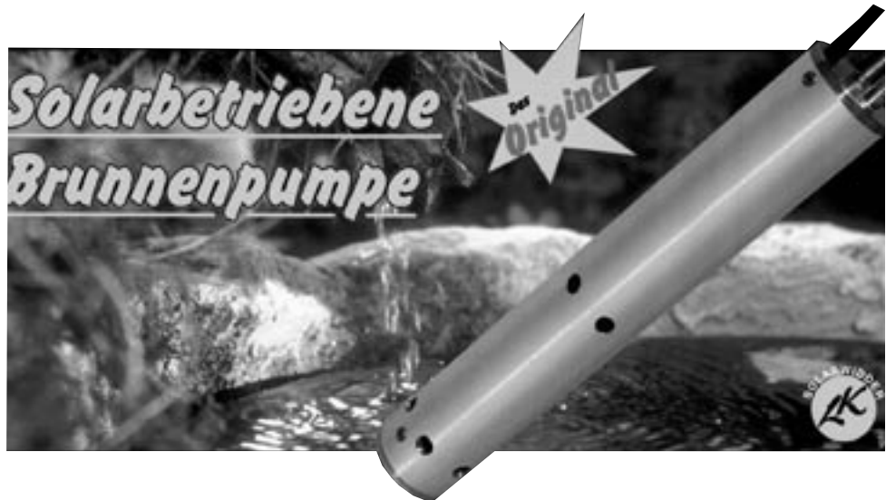
Art.-Nr. 851.970 Solarwider Brunnenpumpe Fr. 750.–

Solenoid = Zylindrische, stromdurchflossene Metallspule, die einen Kolben antreibt.